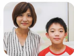
保護者様・生徒様の声

保護者様 自分に自信を持ってくれただけでなく、将来の夢も見つけて実現のために頑張っている姿を見ると、本当に通わせて良かったと思います。授業の中で失敗の原因を考えたり、発表の機会があったりするのありがたいです。