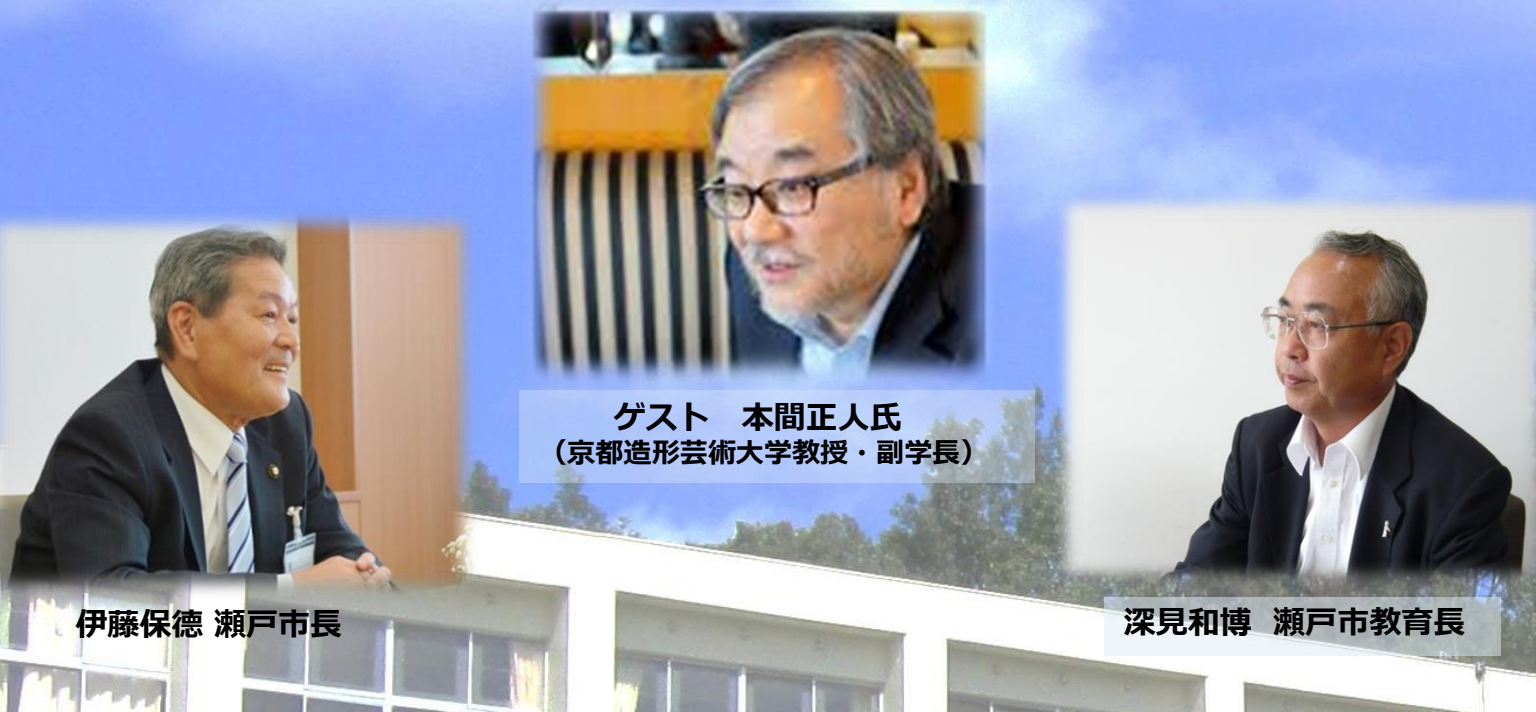
伊藤保徳 瀬戸市長