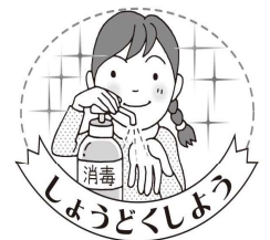
しょうどくしよう