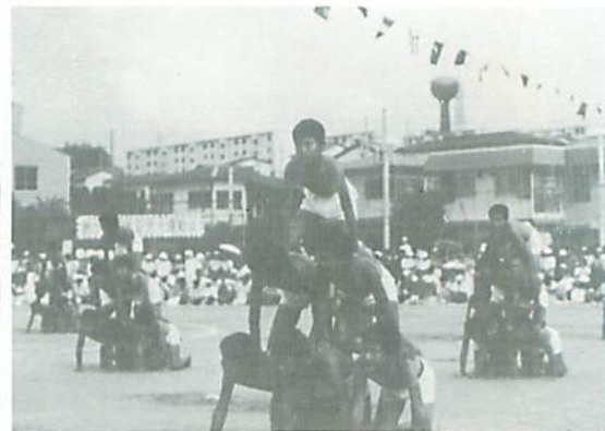
▲ 本番でバッチリ成功した組体操