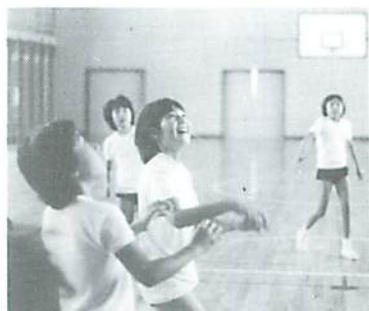
▲ バスケットボール部