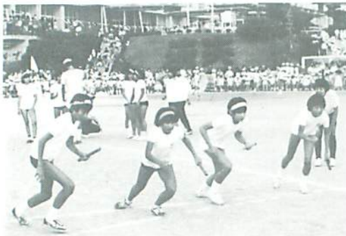
▲ 優勝盾めざし緊張の瞬間