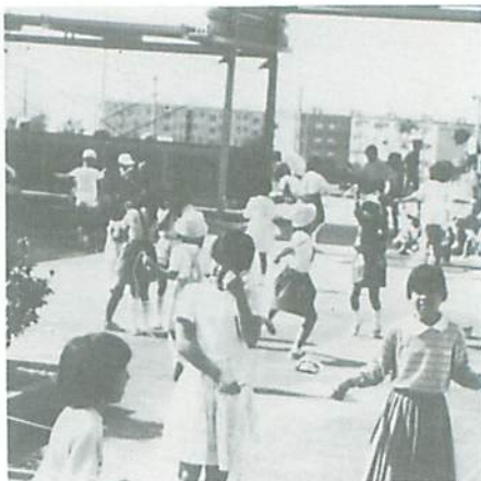
◀ 仲よく体力づくり

萩山タイムが始まって3年目、始業前のかけ足、ラジオ体操、縄とび運動に意欲的に取り組むようになった。縄とび運動は10月の種目で、子どもたちは、進級表の級別種目に挑戦し、楽しくカー杯縄とびをしている。