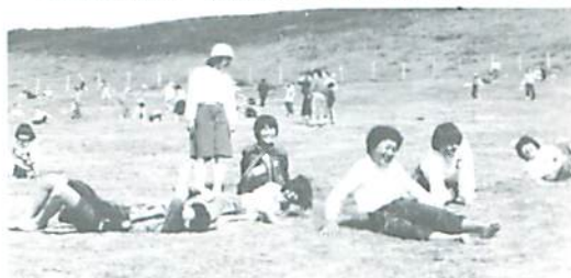
▲ 「わあー気持ちがいい」若草山

2日目は天気も回復し、宇治平等院、東大寺などを見学し、若草山で遊んだ。どこの見学地でも、小学生、中学生、高校生でいっぱいであった。