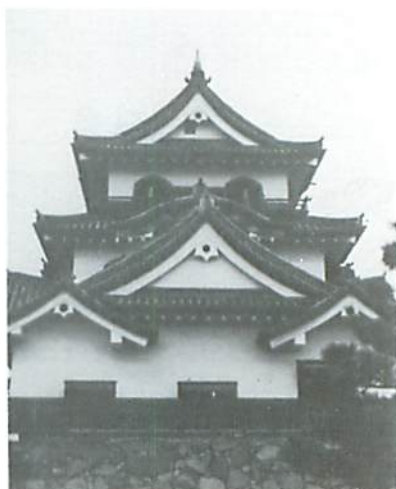
▲ そびえたつ彦根城天守閣