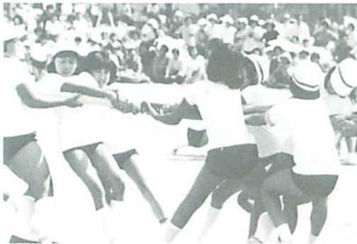
▲ 力いっぱい引っぱった棒引き