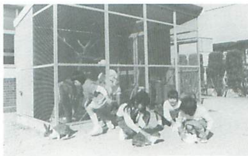
◀ ふえた動物のせわに大活躍

餌やり、飼育小屋の掃除など当番の児童がこまめに世話をしている。ウサギと遊ぶ子どもたちに、動物を愛護する気持や自然を見る目が養われることを大いに期待したい。