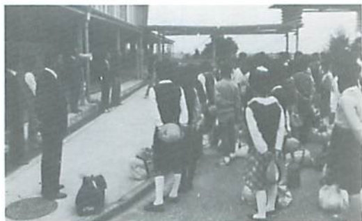
▲ さあ、楽しい修学旅行に出発だ！

今にも降りだしそうな空模様の中、滋賀・奈良方面への修学旅行に出発した。1日目は、彦根城・比叡山延暦寺の見学と外輪船での琵琶湖めぐりであった。途中、比叡山では、風雨も強まり霧もたちこめ、寒さにふるえた。