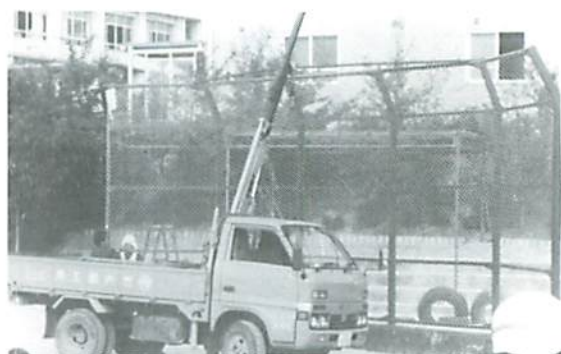
▲ 新しくなったバックネット

あちらこちらに穴があき、補修しながら使ってきたバックネットの金網も全体的にもろくなってきた。そのため、本年度の設備拡充の一環として、金網の張りかえ工事が行われた。