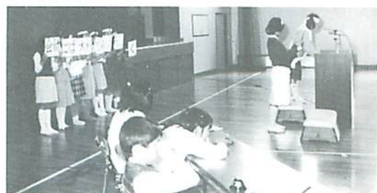
▲ 熱弁ふるう候補者

会長、副会長、書記、会計の候補者が、学校生活をよりよくするための児童会活動のあり方について熱弁をふるう。応援の児童の姿に、必勝の意気込みが感じられる。