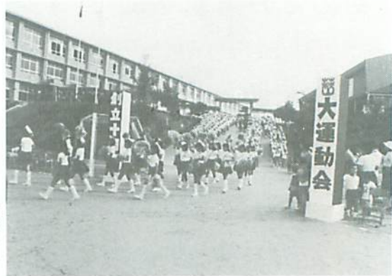
▲ バトントワラーを先頭に、銀河鉄道999の曲に合わせて堂々の入場行進

9月26日、秋空のもとでの運動会。本年は開校10周年記念ということで、開会式でのハトや風船飛ばし、アトラクションとしての新体操模範演技、また、新種目として地区対抗リレーも行れ、例年にない盛大な運動会となった。