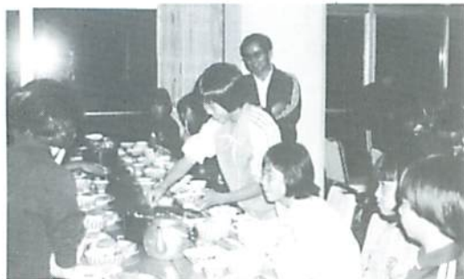
▲ おかわり 何ばいにしようかな