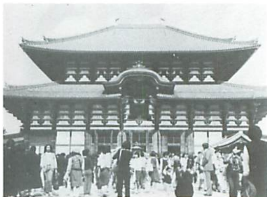
▲ 人、人、人の波だった大仏殿