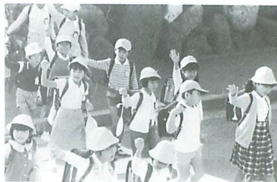
▲ みんなで守ろう交通ルール

交通事故の多発する昨今、登下校のさいの手あげ横断は、子どもの命を守るための大切な交通安全指導のひとつである。右・左・右、よく見てさあ、渡ろう。