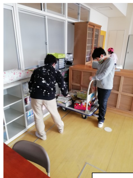
みんなで力をあわせて 引っ越ししたよ。