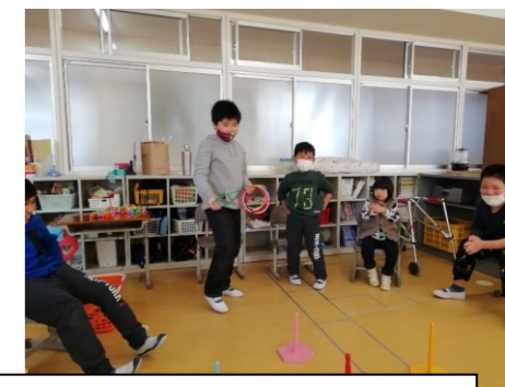
那華さんの誕生日会でゲームをしました